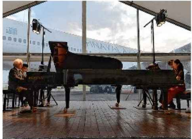
Dans le cadre des concerts hors les murs, les musiciens se poseront à l'aéroport de Châteauroux-Déols.