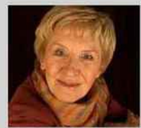
► Michèle Perrot.