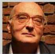
► Bruno Monsaingeon.