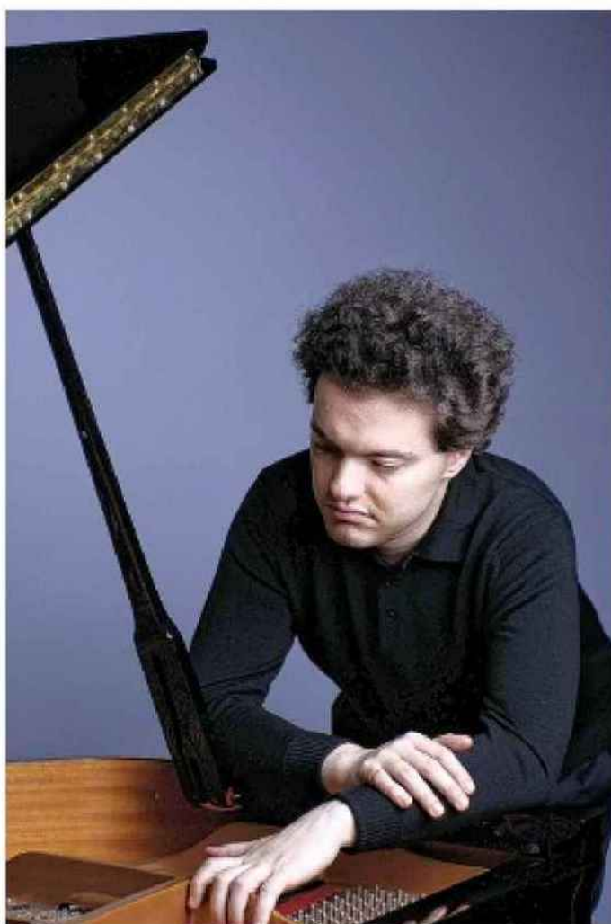
Evgeny Kissin, un des meilleurs pianistes au monde, assurera le concert de clôture.

Annulation, certes non : en juillet, la jauge jusqu'alors réduite à 65 % passera à 100 %. Pour le plus grand plaisir du public qui a montré un grand appétit de concert et musique live mais aussi pour celui des musiciens heureux de retrouver la scène. « Ces deux paramètres conjugués donnent à cette 55 e édition une atmosphère particulièrement chaleureuse, témoigne le président. Et le meilleur reste à venir ! »