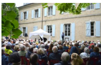
Impromptu musical et littéraire