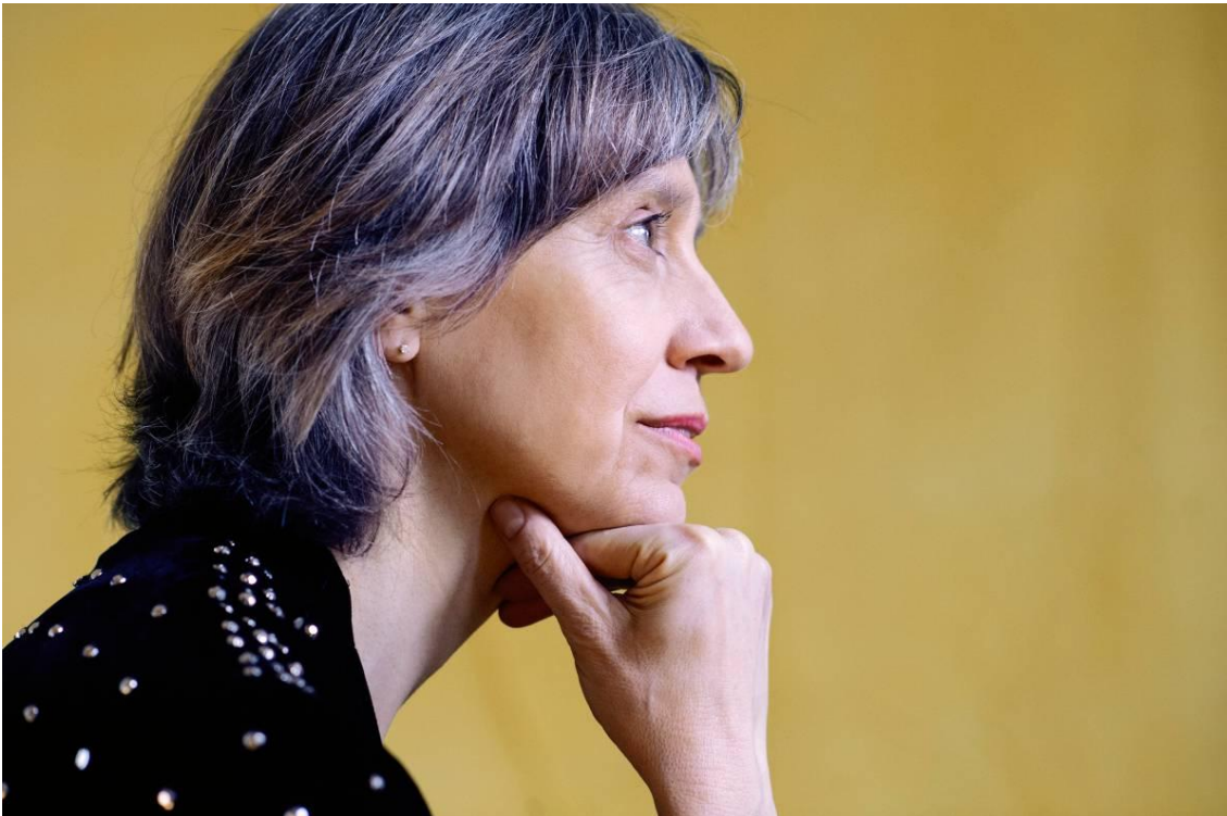
Anne Gastinel.

11 heures : tremplin-découverte. Lauréat du prix Cortit 2022 (piano).